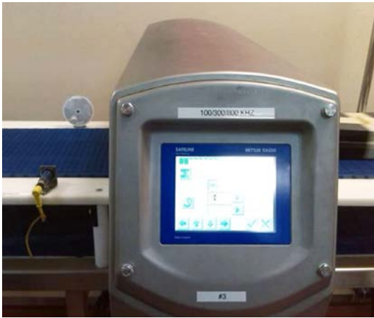
Detector de metales multi frecuencia Mettler Toledo Safeline Power Phase Pro.

Aquí se presenta una tabla de equivalencia entre los tamaños de bandas transportadoras detectables y sus tamaños equivalentes de muestras de acero ferroso.